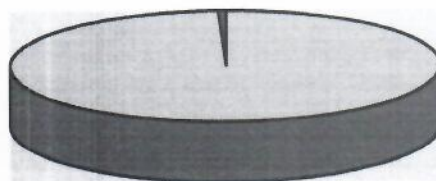
กราฟแสดงจำนวนโครงการที่จัดซื้อจัดจ้าง ในปีงบประมาณ พ.ศ.๒๕๖๕